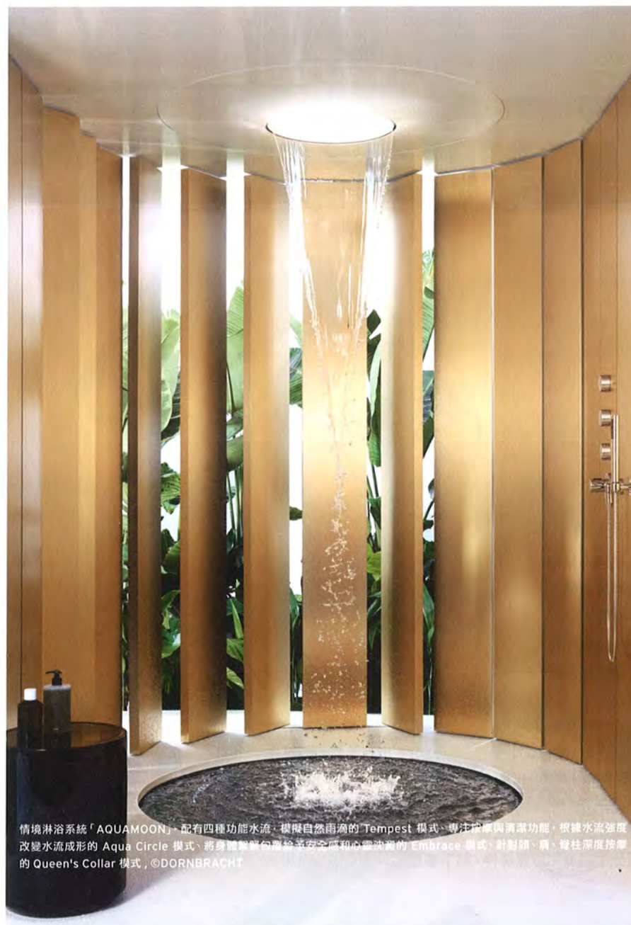
情境淋浴系統「AQUAMOON」，配有四種功能水流：模擬自然雨滴的 Tempest 模式、專注按摩與清潔功能，根據水流強度改變水流成形的 Aqua Circle 模式、將身體輕鬆包裹給予全身區和心靈洗滌的 Embrace 模式、針對頸、肩、背柱深度按摩的 Queen's Collar 模式

今年的米蘭家具展上 DORNBRACHT 為浴室核心設備提出最新提案，「AQUAMOON」情境淋浴系統為淋浴帶來更多層次的身心靈療癒效果，由月亮與水結合的優雅形象轉化為四種水流模式，分別滿足放鬆舒壓的感性需求和清潔、舒緩肌肉的生理需求，利用水滴從高空落下的重力達到水療按摩的功效，或是從包裹身體的環繞式水流獲得心理的安全感，「AQUAMOON」實踐了居家浴室具備 SPA 水療的理想。