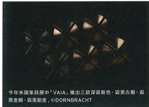
今年米蘭家具展中「VAIA」推出三款深霧新色：霧黑古銅、霧黑金銅、霧黑鉑金，©DORNBRACHT